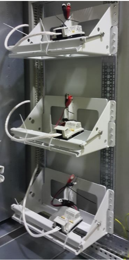
Рисунок 3 – Крепление АКБ на вибростойке BATTERY MOUNTING CASE

Благодаря использованию источников питания QUINT-PS, QUINT-UPS и батарей UPS-BAT, удалось обеспечить стабильную работу и надежный запуск ёмкостных нагрузок. Крепление АКБ на вибростойке BATTERY MOUNTING CASE позволяет обеспечить одностороннее обслуживание всего оборудования в шкафу, в том числе и аккумуляторов.